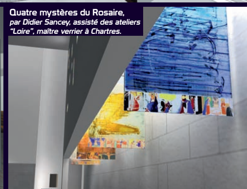
Quatre mystères du Rosaire, par Didier Sancey, assisté des ateliers "Loire", maître verrier à Chartres.