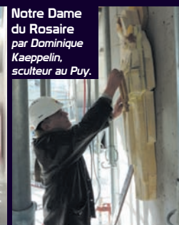
Notre Dame du Rosaire par Dominique Kaepplin, sculpteur au Puy.