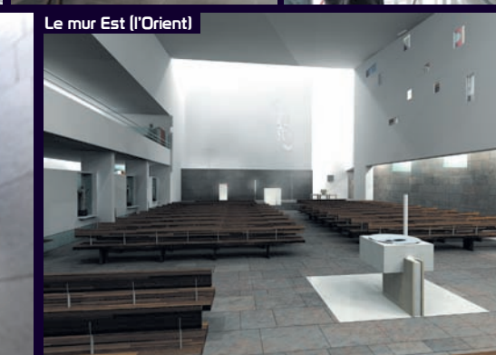
Le mur Est (l'Orient)