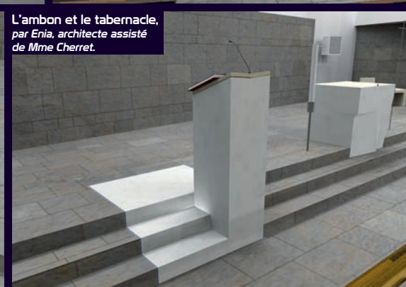
L'ambon et le tabernacle, par Enia, architecte assisté de Mme Cherret.