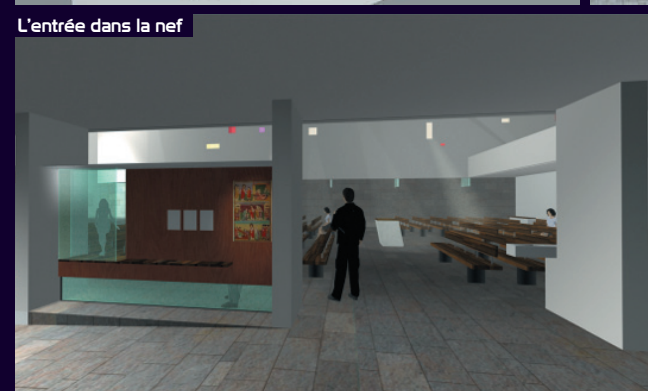
L'entrée dans la nef