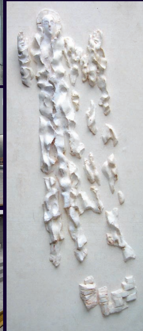
Le Christ en gloire, par Claude Abeille, sculpteur, membre de l'académie des Beaux Arts de l'Institut de France.