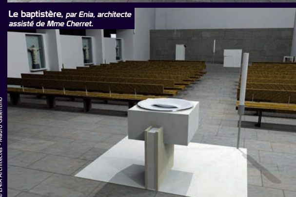
Le baptistère, par Enia, architecte assisté de Mme Cherret.